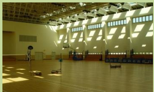
多功能室內綜合球場