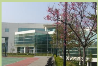
3,770坪旺宏同仁活動中心暨旺宏學苑