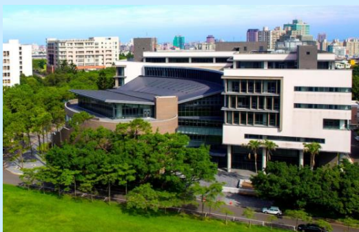
清華學習資源中心-旺宏館