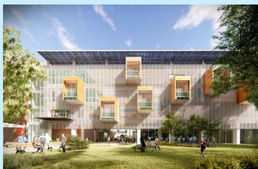
成功創新中心-旺宏館(預計2021年完工)