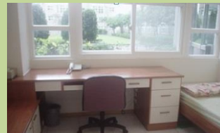
工程師專屬單人套房